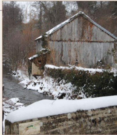
Moulin sur l'Arnon.

Charmante rivière prenant sa source en Creuse, l'Arnon serpente le bocage de la région. Ancrés au sein du paysage, le moulin de la Vie et le moulin du Vert jalonnent la rivière (deux propriétés privées). Le chemin de randonnée des Maîtres Sonneurs traverse le cœur du hameau du moulin de la Vie. Le moulin du Vert lui, est construit dans un site encaissé et la digue monumentale barre l'Arnon en créant un étang. Siège d'un fief important au Moyen Âge, le moulin était certainement fortifié par un château chargé de contrôler